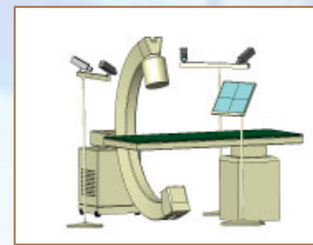
รูปที่ 1 แสดงรูปแบบการใช้ Fluoroscopy ร่วมกับระบบกล้องถ่ายภาพเคลื่อนที่แบบทัวไป

ระบบนำทางสำหรับช่วยในการผ่าตัด ประกอบด้วยส่วนต่างๆ ที่ทำงานร่วมกัน (ดูรูปที่ 1) โดยมีส่วนที่ต้องพัฒนาดังต่อไปนี้ (1) ระบบวัดพิทักของวัตถุในสามมิติ (2) วิธีการในการวางแผนวิธีการผ่าตัดจากภาพถ่ายรังสี (3) วิธีการทางคณิตศาสตร์เพื่อคำนวณตำแหน่งของวัตถุเมื่อเกิดการเคลื่อนที่ และ (4) โปรแกรมคอมพิวเตอร์เพื่อแสดงผลกับผู้ใช้